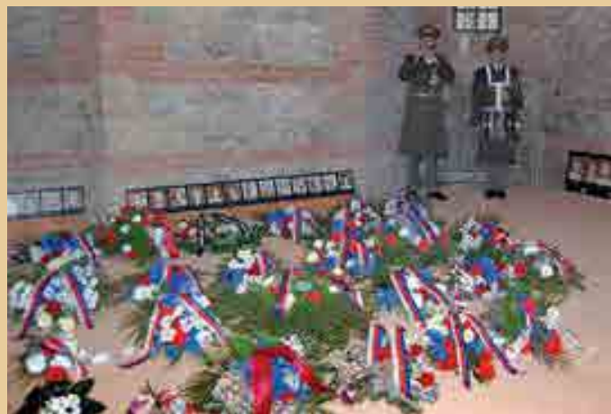
Sklepení Larischovy vily

Odplatou za atentát a odbojovou činnost byla 24. června 1942 vypálena obec Ležáky. Od 3. června do 9. července 1942 bylo v Pardubicích na popravišti u Záměčku popraveno 194 spolupracovníků odboje a obyvatel Ležáků.